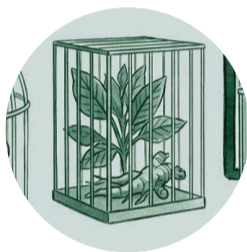
Saberes indígenas poco reconocidos