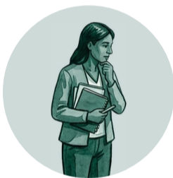
Perspectivas feministas y decoloniales marginadas

Persisten formas de EXCLUSIÓN dentro y fuera de la academia: