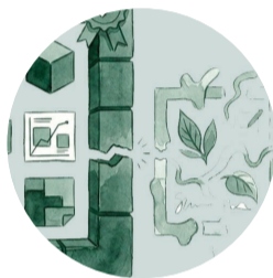
Menor legitimidad para metodologías críticas