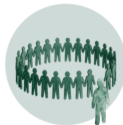
Racismo y exclusión epistémica

Esto limita la diversidad del conocimiento y reproduce DESIGUALDADES