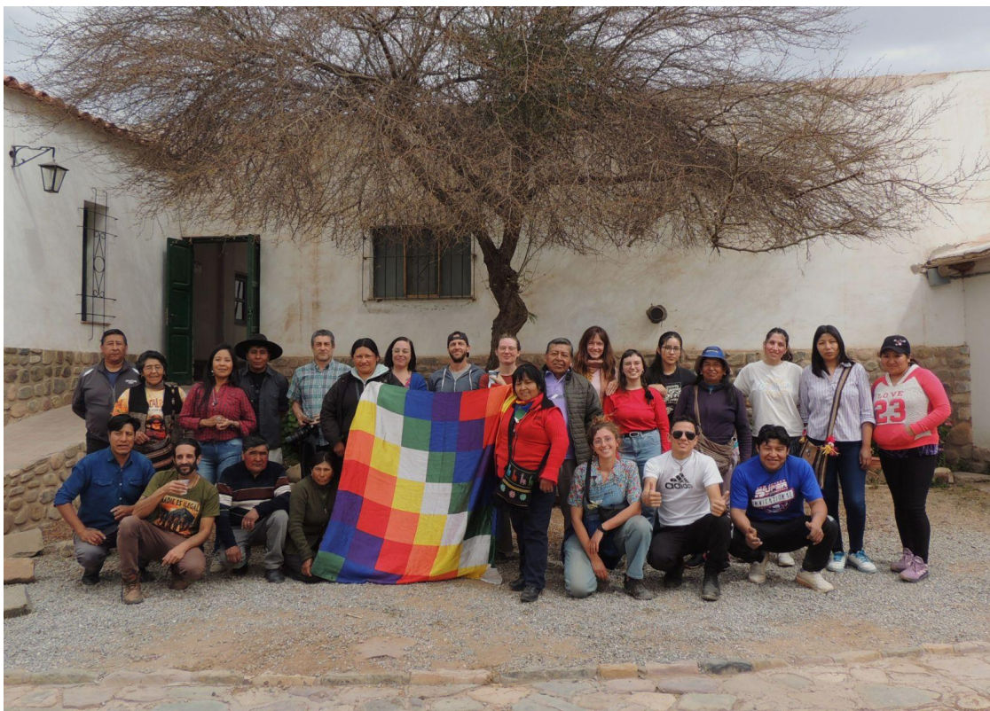
Final de la Jornada-Taller en el Instituto Interdisciplinario de Tilcara. 3 de septiembre de 2025. Integrantes de comunidades indígenas y organizaciones y Equipo de Antropología de las Políticas de Desarrollo y Territoriales (ICA-FFyL-UBA).