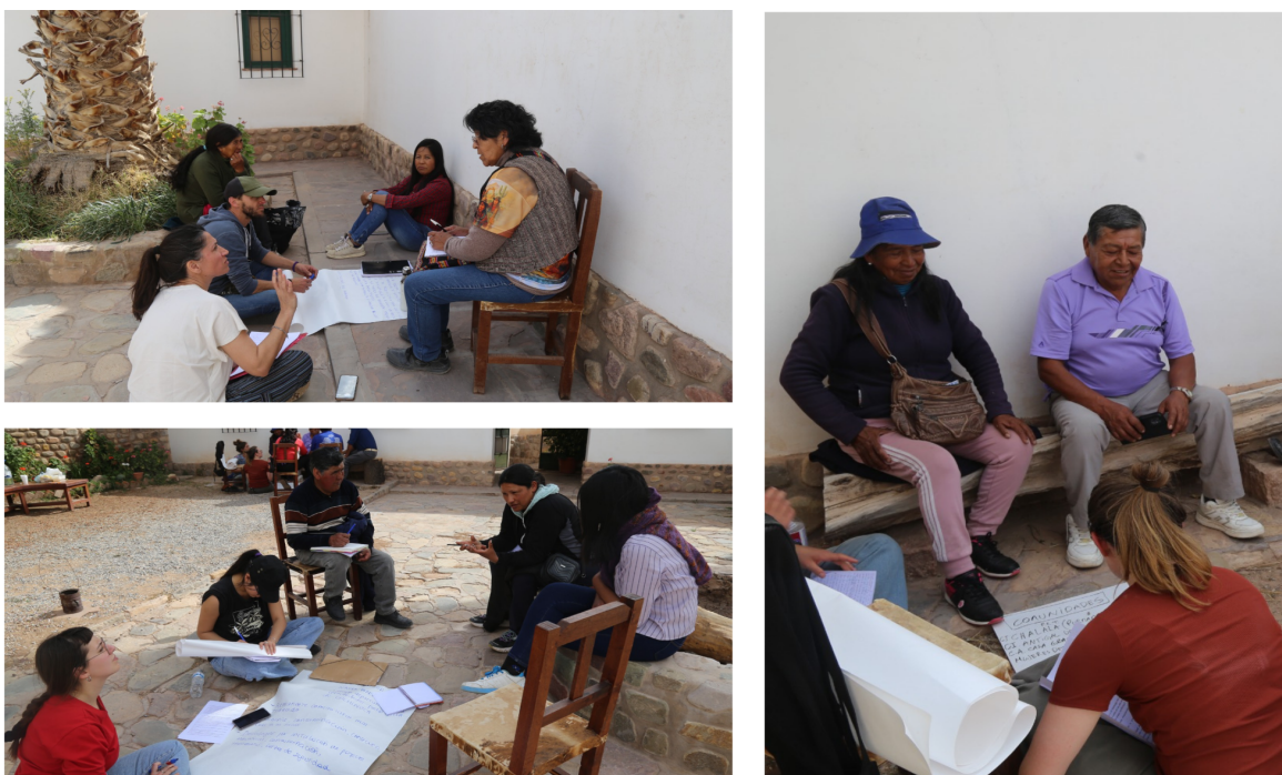
Registros del trabajo en comisiones con integrantes de comunidades y organizaciones indígenas. Instituto Interdisciplinario de Tilcara.

En el informe además se recuperan las experiencias de los asistentes de la Jornada-Taller, que afirman que en los casos en que se realizan procesos de consulta estos se hacen incumpliendo las formas y lógicas comunitarias. Al respecto, Daniel sostiene: “En 2003 sufrimos una represión y eso me llevó a involucrarme. Decimos que somos dueños de todo, [pero] después se declara tal lugar como patrimonio de la humanidad y no se nos consulta nada. Fue durante la Reforma que me involucré. Nadie nos defiende”.