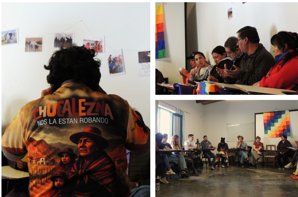
Jornada-Taller, Instituto Interdisciplinario de Tilcara.

Para situar el presente de las comunidades indígenas y sus reclamos, se considera que una lectura histórica puede aportar a la comprensión de ciertos procesos, ya que en muchos casos las demandas se retrotraen a tiempos inmemoriales. Estas se vinculan, por un lado, a experiencias de arraigo territorial fuertemente consolidadas en la memoria familiar y colectiva de las comunidades locales y en documentación historiográfica probatoria, y por otro lado, a los permanentes impedimentos jurídicos para efectivizar o regularizar el reconocimiento de esa relación vital entre el territorio y su gente.