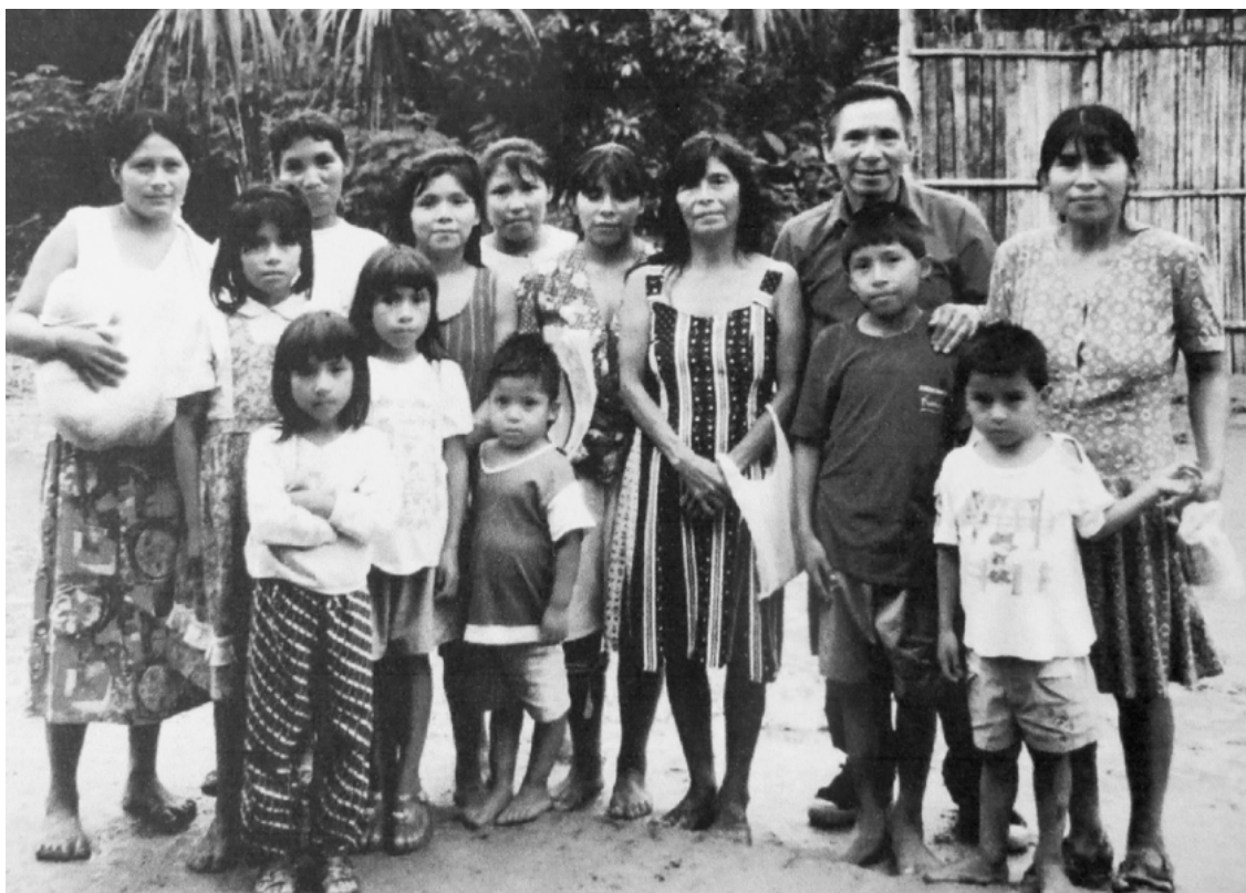
Antiguamente, la justicia awajún se basaba en la autotutela, el diálogo y el liderazgo de los mayores.

discusión muy elitista, centrada en la dirigencia, en una intelectualidad indígena y no indígena que no tuvieron la capacidad de llevar a los territorios”. Esto se apoyaba también en estudios que daban cuenta de que la opinión pública prefería el concepto de multiculturalidad o mostraban muy poco apoyo para la plurinacionalidad.