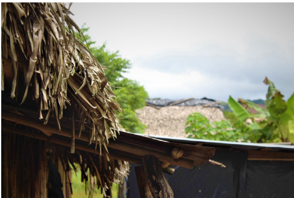
Imagen 3. Viviendas autogestionadas en Finca San Andrés