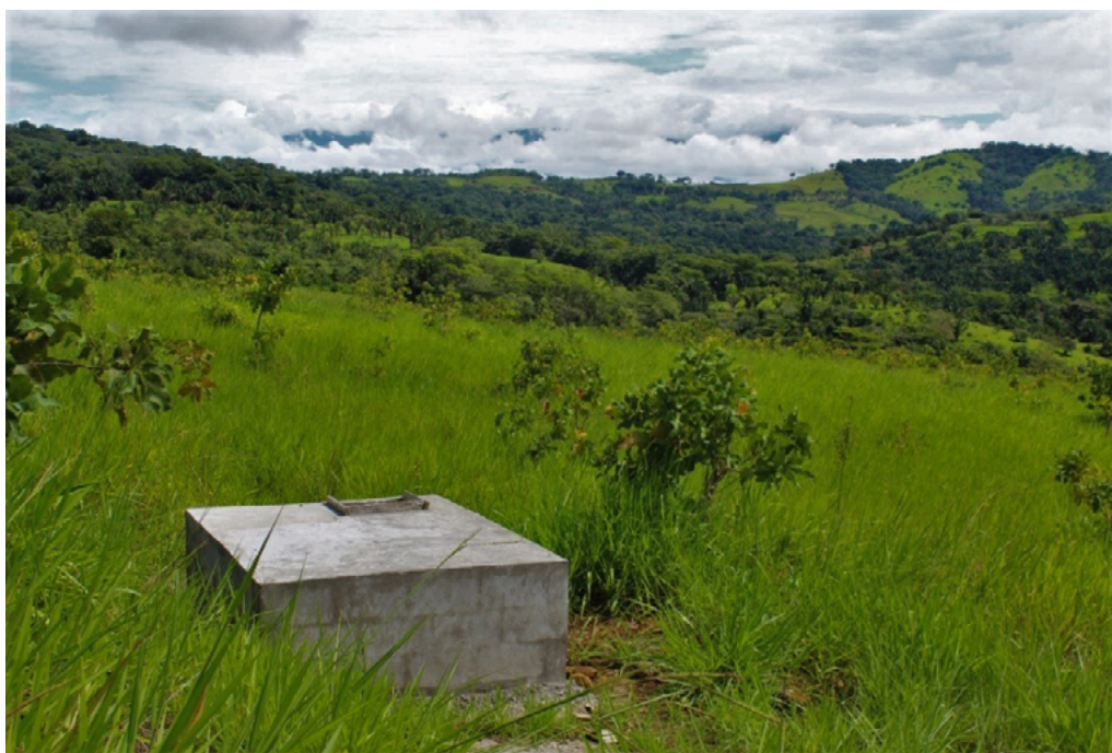
Imagen 1. Tanque autogestionado de recepción de agua en Finca San Andrés