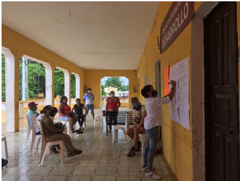
La Junta en capacitación sobre Derechos.