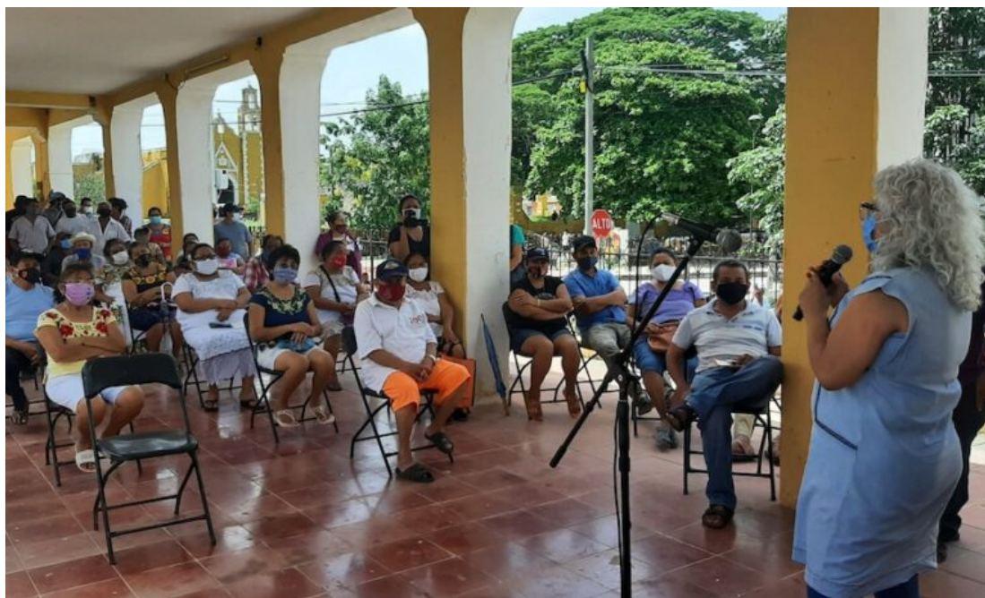
Asamblea de elección de la Junta de pobladores.