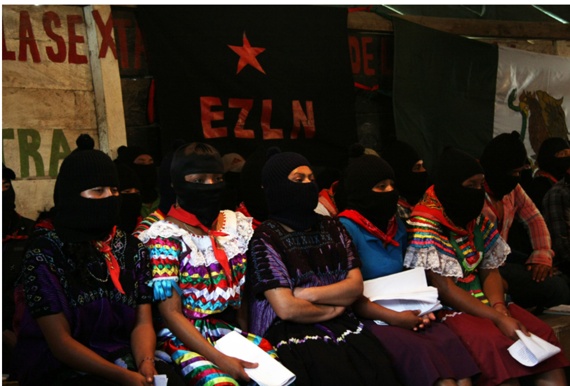
Mujeres Zapatistas.

Los mayas zapatistas han fortalecido los tres niveles de gobierno: el comunitario, el zonal y el regional, que en la hipótesis de la red de Latautonomy se explica así: La sostenibilidad de un sistema autónomico depende de su capacidad de vincular el nivel de las comunidades locales con una estructura regional de manera horizontal e interactiva. A través de un proceso de integración desde abajo se deben crear estructuras políticas económicas participativas que se articulan tanto dentro de las autonomías multiculturales como hacia afuera, generando un proyecto de sociedad alternativa. Esta hipótesis va tanto en contra de cualquier localismo etnocentrista como contra representaciones jerárquicas que impiden el desarrollo de mecanismos participativos en la toma de decisiones políticas ( idem ).