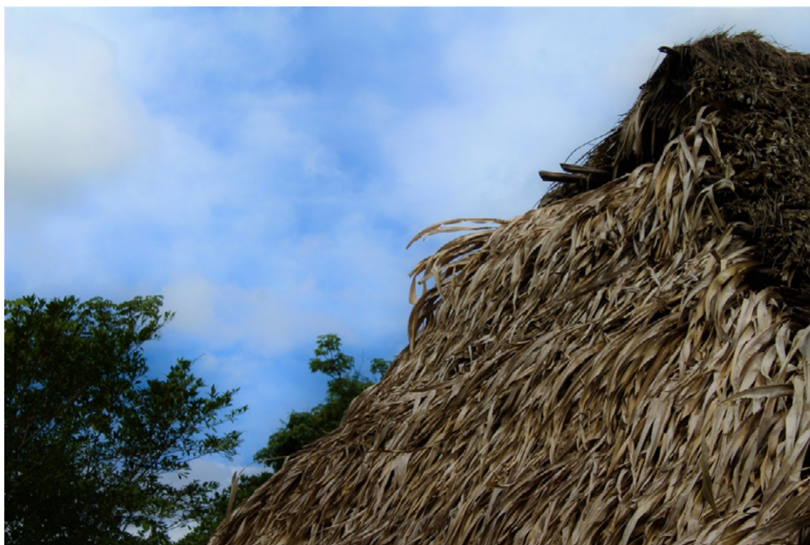
Imagen 2. Techo de rancho de palma del pueblo bröran