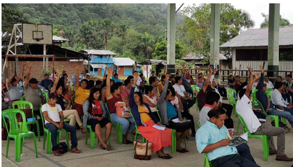
Gobierno Territorial Autónomo Awajún. Crédito: Alejandro Parellada.

El pueblo de la Amazonía peruana tiene la meta de construir una justicia autónoma e intercultural que reincorpore el derecho consuetudinario y las sanciones dialogadas que aplicaban los sabios y los ancianos. Para ello, el Gobierno Territorial Autónomo Awajún intenta limitar las