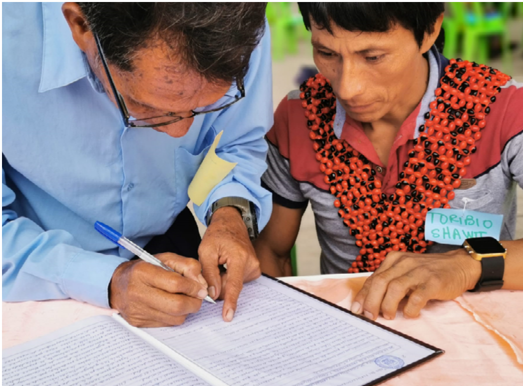
La adopción de sanciones basadas en el encierro prolongado va en contra de la cultura awajún y perjudica a la justicia comunitaria.

la vida, la salud, la integridad física, psíquica y moral, la libertad, entre otros o que puedan afectar de alguna forma los intereses de aquellas personas ubicadas en condición especial y/o sensible como los niños, los adolescentes, las mujeres en estado de embarazo, los ancianos, etc”.