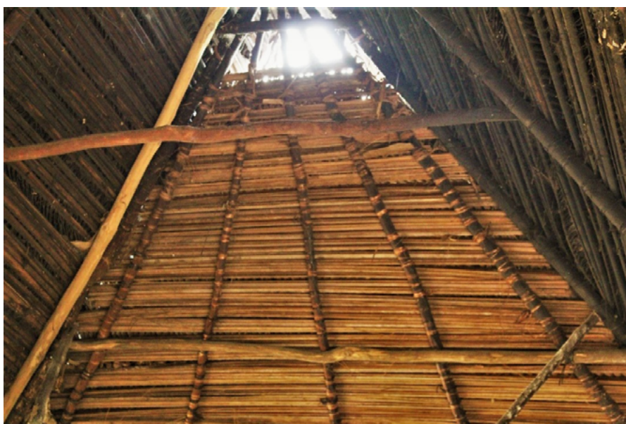
Imagen 4. Amarrado interior del techo de palma bröran