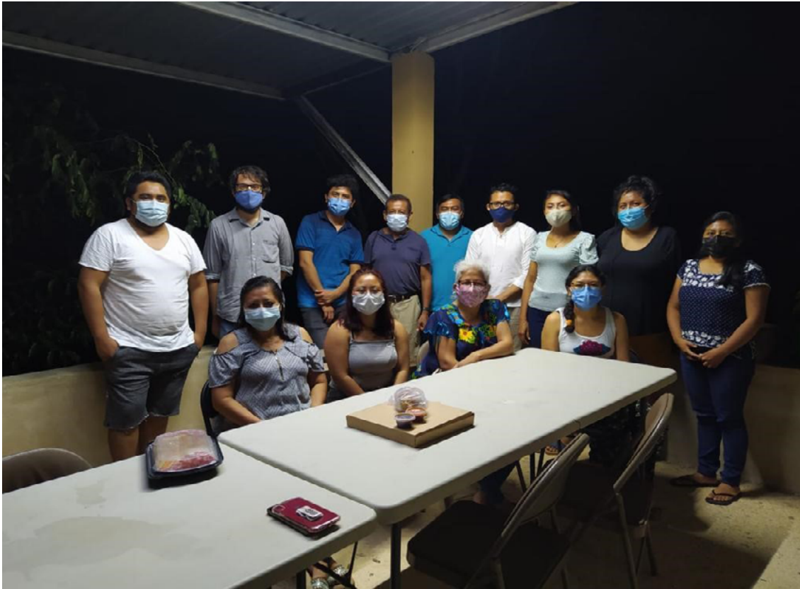
Junta Pobladores Representante Comisaría Municipal.