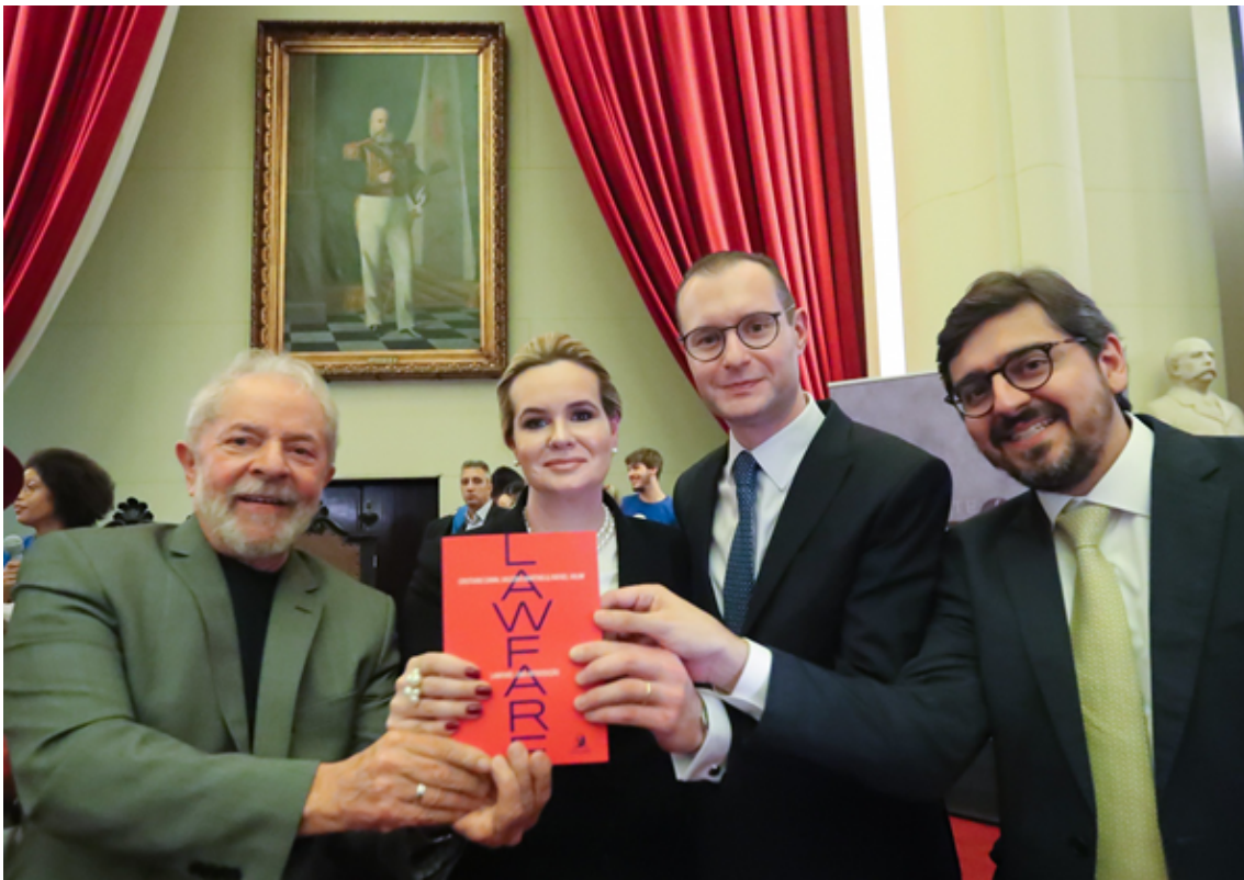
Los autores en una presentación del libro junto al expresidente brasileño Luiz Inácio Lula da Silva.

técnico, y sus agentes en el seno del Estado — jueces, legisladores, etc. — se consideran imparciales. Tal lectura roza la ahistoricidad y la naturalización del derecho: donde hay sociedad hay un derecho; el orden es preferible al desorden; el juez es el vocero de la ley, etc.