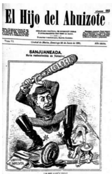
Imagen 1. El hijo del Ahuizote , junio 28, 1891, núm.283, Tomo VI, p. 1

1890. El hijo del Ahuizote 26 publicó en sus portadas los efectos represivos de esta antigua categoría filosófica y nueva categoría científica que, en cualquier caso, justificaba el sometimiento de la clase política sobre la población pobre e indígena (véanse las imágenes 1, 2 y 3). Así se entiende que para algunos se trató de un término científico que campeó en distintos escenarios de la vida pública como arma de control social (Revueltas Valle, 1990). La política porfirista contaba ahora con el garrote, machete o fueute de la psicología para ordenar la vida social.