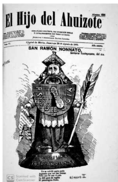
Imagen 2. El hijo del Ahuizote , agosto 30 ,1891, núm.292, Tomo VI, p. 1